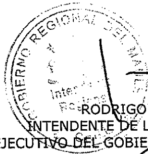
RODRIGO GALILEA VIAL INTENDENTE DE LA REGIÓN DEL MAULE EJECUTIVO DEL GOBIERNO REGIONAL DEL MAULE